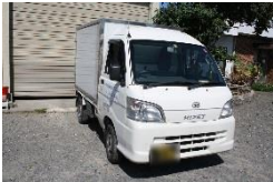
冷凍車のご用命も是非(軽冷凍)