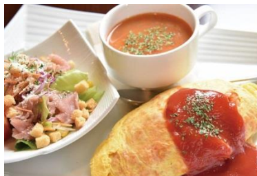
オリーブの樹プレート

南千木町の伊勢崎高校近くにイタリアンレストランがある！ イタリアごはんは、豊富なワインをリーズナブルに提供している「オリーブの樹」さんです。 ランチタイムは、各種パスタやオムライス、プレートと賑やかな雰囲気です。 メニューは、料理とワインを組み合わせるスタイルです。 写真の組み合わせは、（メイ）ス＋（サブ）生ハムシール。 店内はファミリールームからデザートまで気軽に利用できる、明るく親しみやすい雰囲気です。 お子様メニューがあるのもポイント高いですね！ ガーサラダ&スープ。女性好みのヘルシーバランスのセットです。 ドリンクとデザートも付いて、1280円～1480円。 夜はこだわりのワインが豊富にそろい、ワイン好きさんにオススメです。ワインに合うアラカルトも多数♪