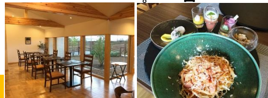
ランチタイムパスタ

こちらは伊勢崎では少数派の本格イタリア料理を提供するレストランです。都内の有名店で腕を認められたシェフが伊勢崎に新店を出した期待のお店です。 野菜はできる限り新鮮な地元野菜を。魚は築地から直送し、お肉も素材の良さを生かす最高の調理法で仕上げます。 そんな最高のお料理を堪能するには、是非コースでゆっくり召し上がってほしいところですよ。 ランチタイムには「前菜盛り合わせ+パスタ+コーヒー」千五百円写真もご用意。メインはお肉にも変更可能です（プラス料金あり）。パスタは5種類から選べます。オーナー自慢の店内も、北欧に和テイストが加わった落ち着いた雰囲気。こだわりぬいた、個性的な器も必見です。