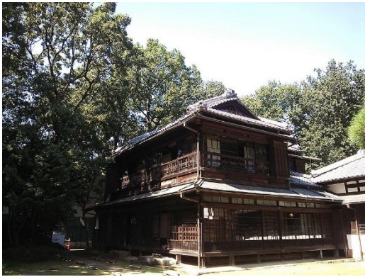
2.26の現場 高橋是清邸

2016.11.1 小平市 江戸東京たてももの園 発行元 小久保運送有限公司 0270-32-1542